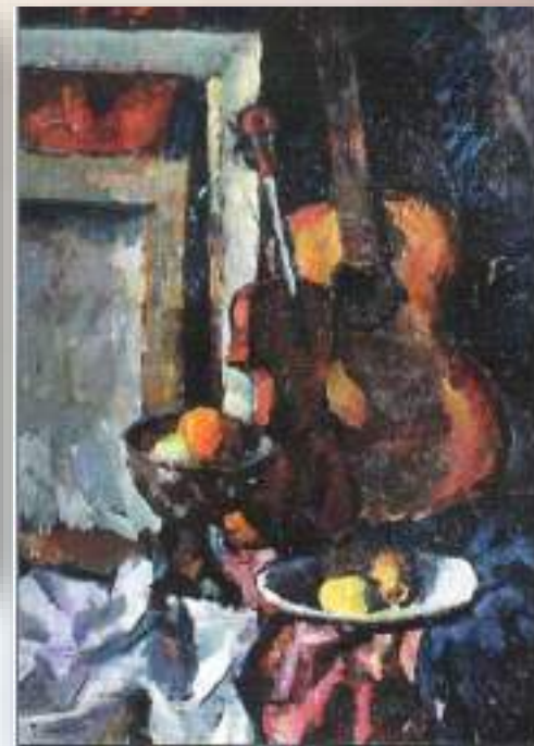
«Натюрморт со скрипкой» 1981 г.