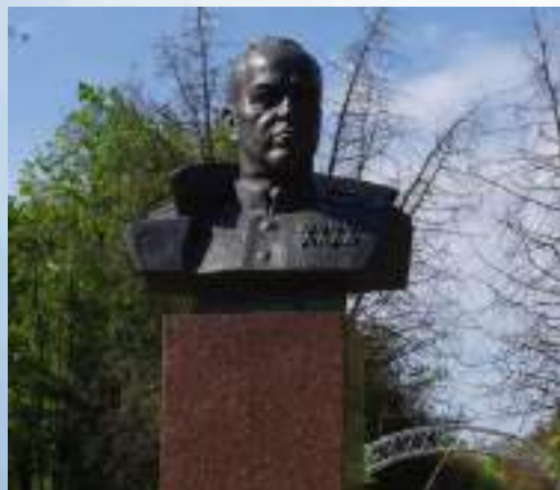
Бюст маршала Г. К. Жукова