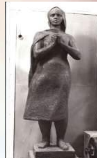
«Скорбящая». из серии «1941 год»