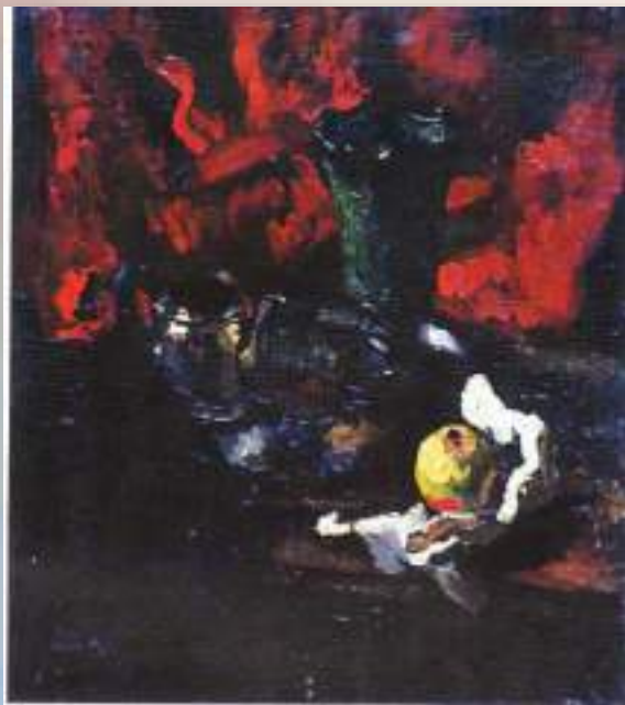
Натюрморт с красной драпировкой» 1978 г.