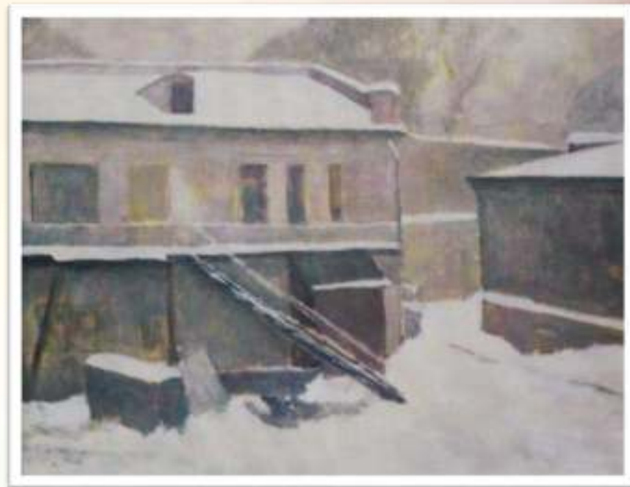
«Двор зимой». 1990 г.