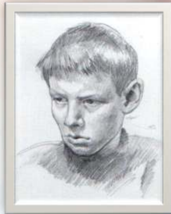
«Портрет сына». 1989 г.