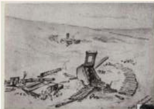
Пески Оса, 1944