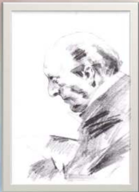
«Владимир Горовиц» 1986 г.