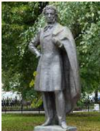
Памятник А. С. Пушкина