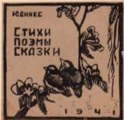
«Стихи, поэмы, сказки». Линогравюра. 1941 г.