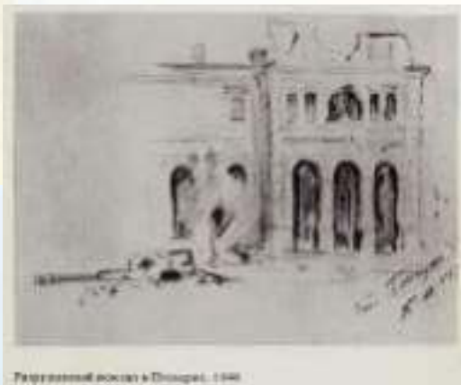
Парламентский корпус в Тонкине, 1940