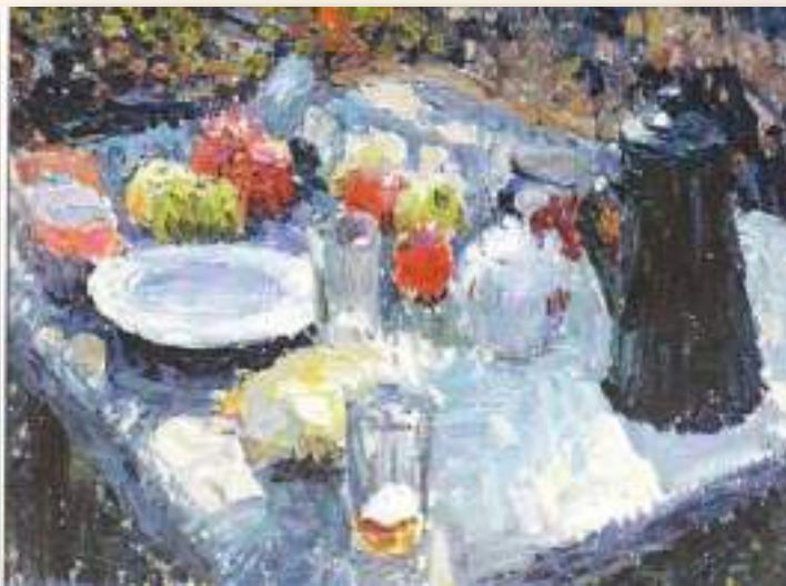
«Натюрморт» 1974 г.