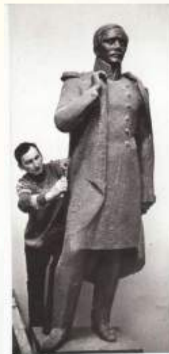
Памятник М. Ю. Лермонтова