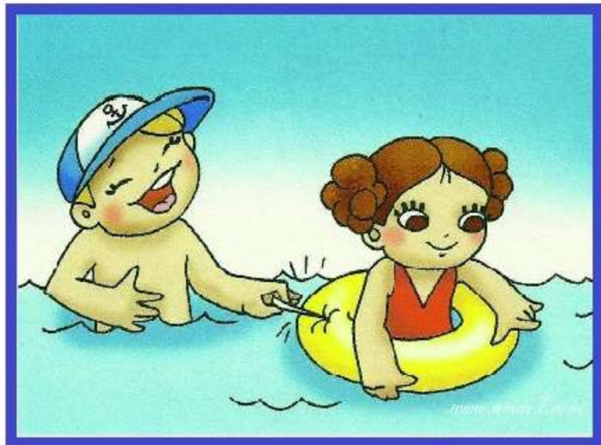
Не делай дырки в круге, не рискуй жизнью!