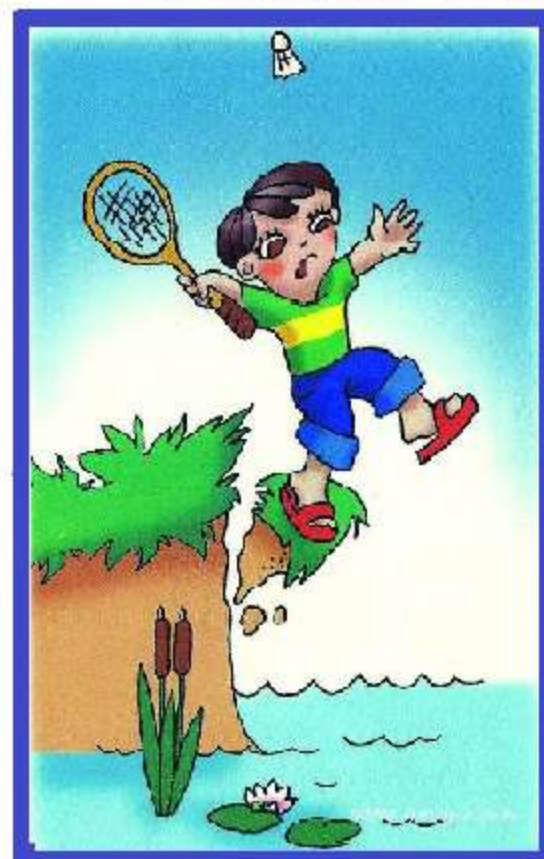
На высоком берегу, лучше не играть! Из под ног может уйти земля!