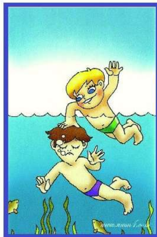
Играя на воде, не топи другого. Можно нахлебаться воды или утонуть.