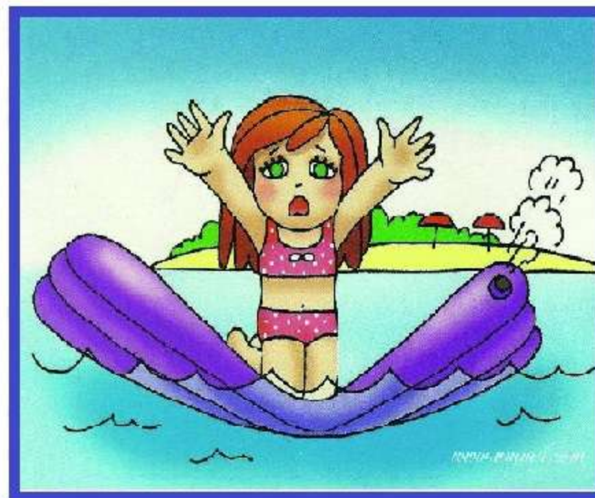
Не заплывайте далеко в воду на надувных средствах!