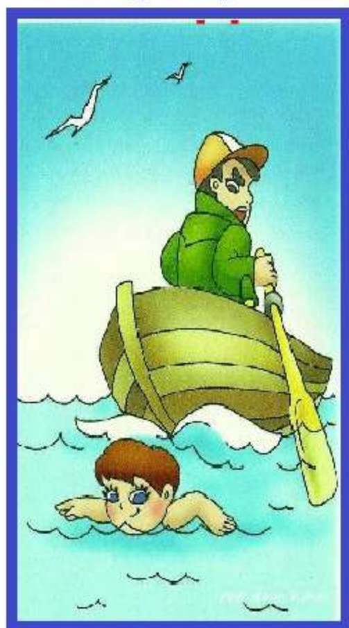
Близко к кораблям и лодкам – не подплывай!