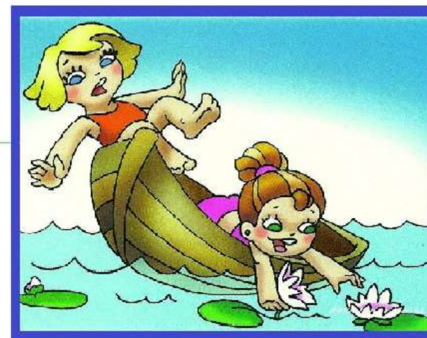
Не катайтесь на лодке без взрослых! И не раскачивайте ее!