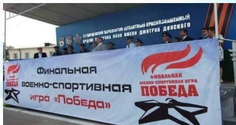
Всероссийские молодежные военно-патриотические игры, олимпиады, конкурсы