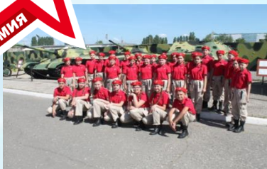
Профильные специализированные формирования юнармейцев (юных летчиков, моряков, десантников, танкистов, и другие)