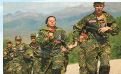
Всероссийские молодежные спартакиады по военно-прикладным видам спорта, сдача норм ГТО