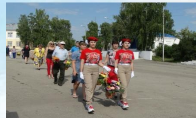
Детско-юношеские военно-патриотические, военно-исторические клубы