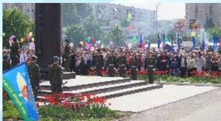
Юнармейские посты у Вечного огня, обелисков, мемориалов, участие в воинских ритуалах