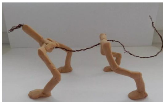
Рис.2. Устойчивость формы из пластилина на основе каркаса из проволоки

В конструкциях из пластилина для обеспечения устойчивости формы при температурных и силовых воздействиях используется каркас из проволоки (рис.2)